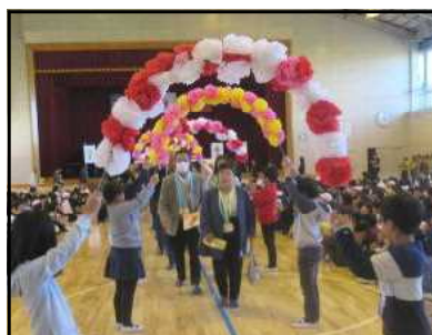
学校応援団感謝の会