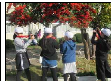
ジュニアフォトグラファー