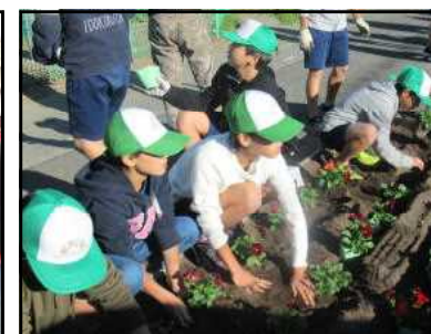
県道花壇の花植え活動