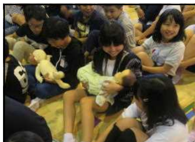
命の大切さを伝える授業